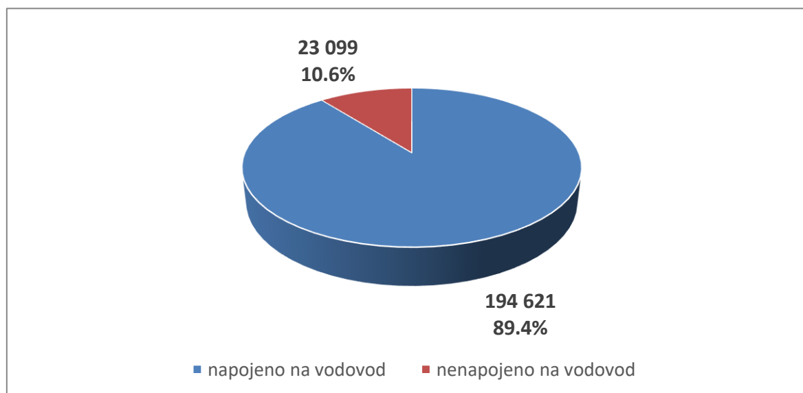
Obr. 3. Rozsah zásobení pitnou vodou v ÚC Brno-venkov v roce 2017

Rozsah a způsob zásobení trvale bydlících obyvatel pitnou vodou v ÚC Brno-venkov ve výchozím roce 2017 vyjadřuje graf na Obr. 3.